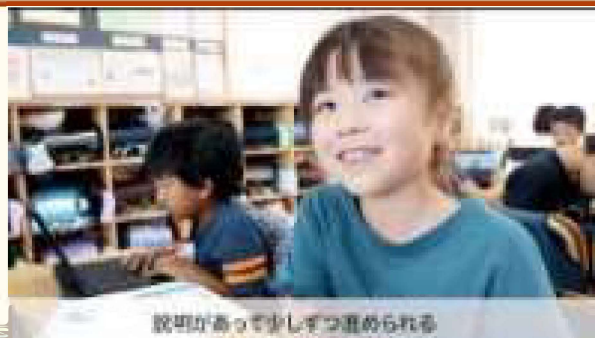
説明があって少しづつ進められる